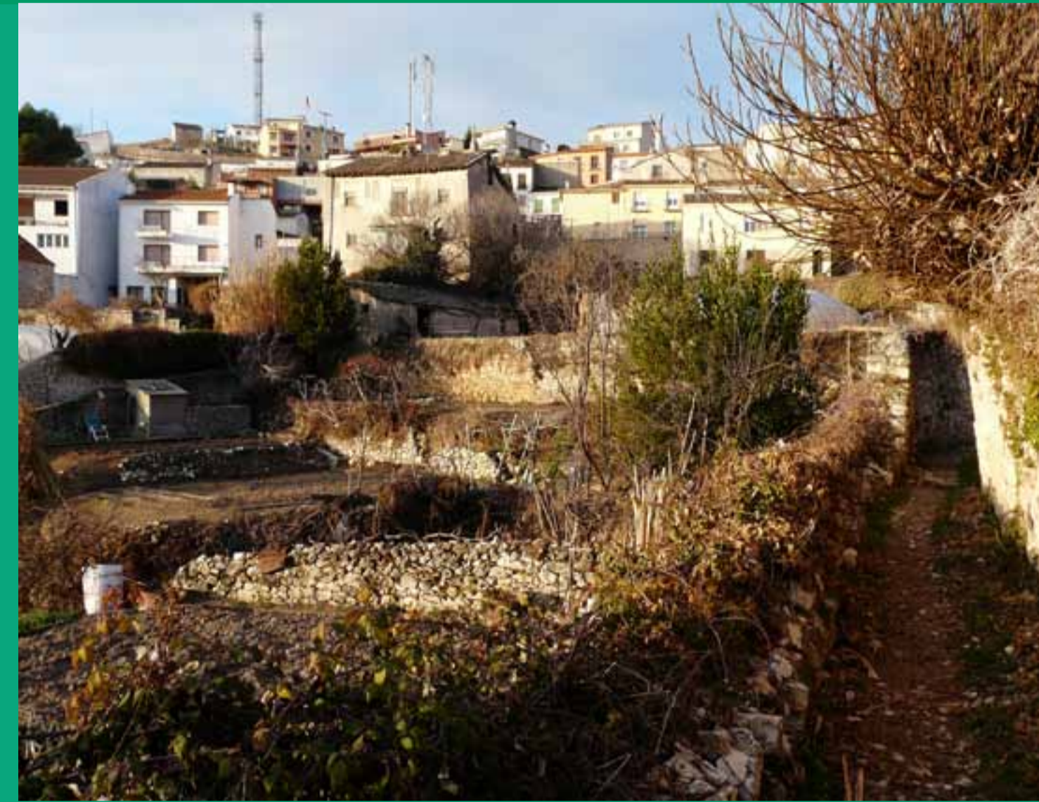
Huertos en Horche