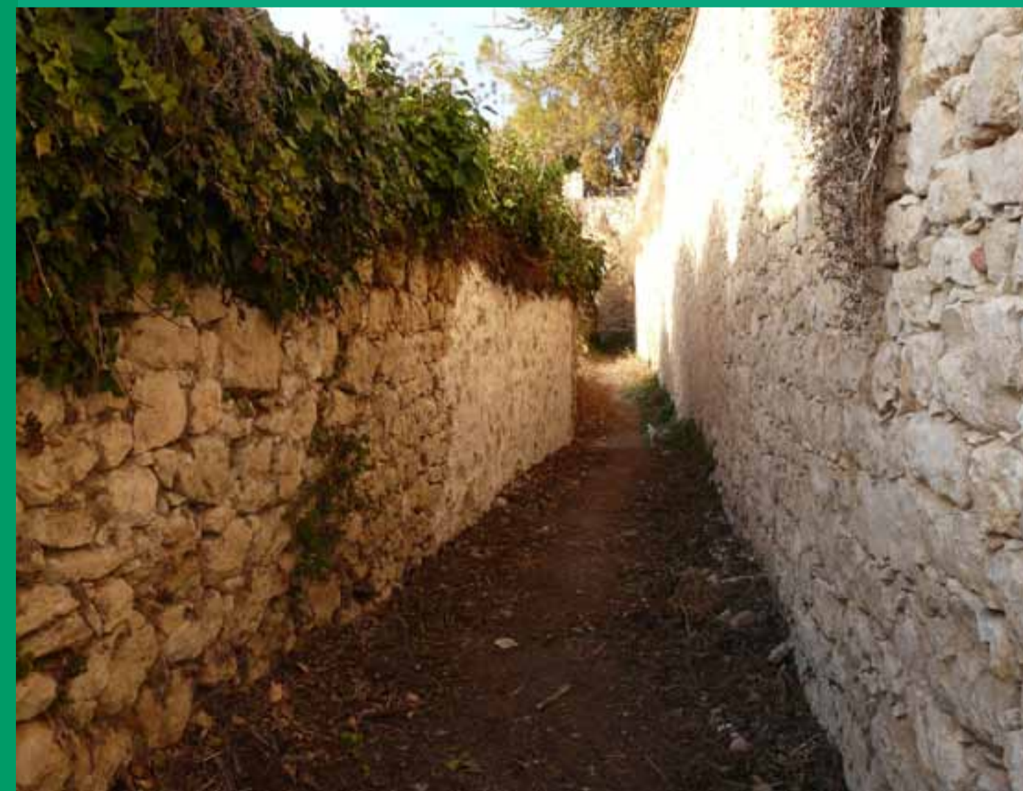
Callejón entre huertas