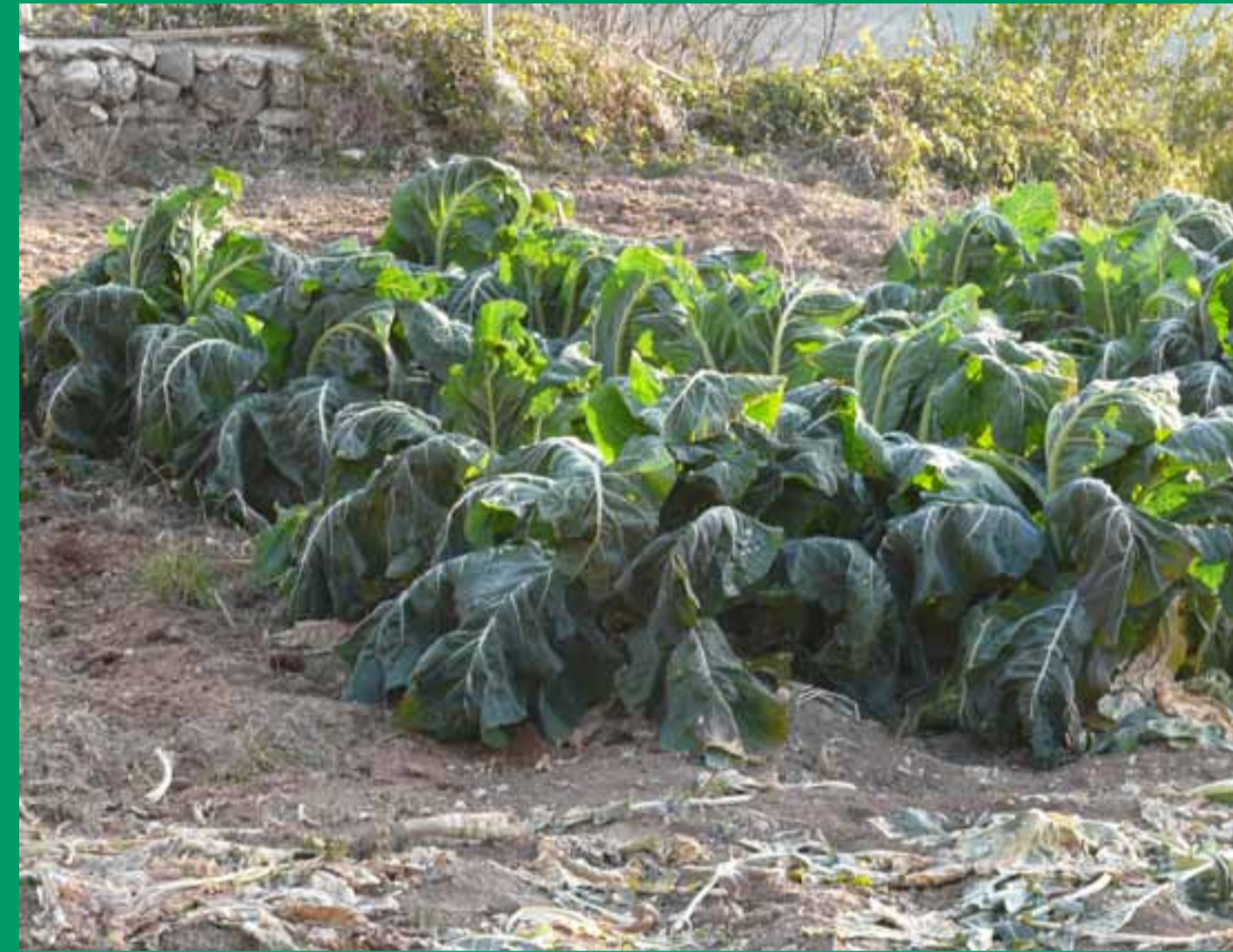
Huerto de invierno. Coles