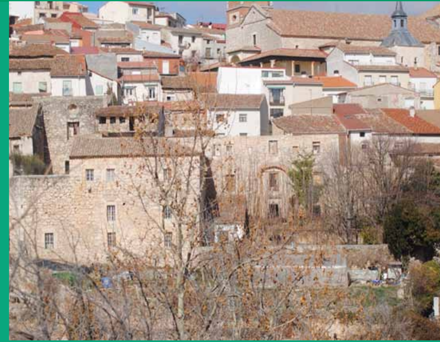
Horche. En primer plano, convento franciscano