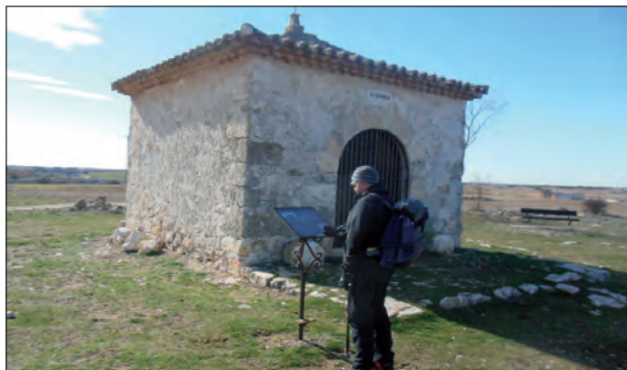
Senderista en la ermita de San Isidro

Desde aquí en pocos minutos volvemos a la oficina de turismo, dejando a un lado la plaza de toros, donde finalizamos esta pequeña excursión.