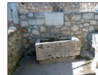
La Fuente del Cura

A casi un kilómetro del cruce anterior llegamos a la Fuente del Cura, la tenemos a la izquierda, bajando unos escalones. Se trata de una fuente de un solo caño del que mana abundante agua y de un pilón. Aunque la fuente se construyó en 1913, fue