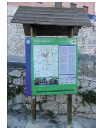
Panel de la ruta

El nuevo camino recibe el nombre de Camino de la Fuente del Cura y al principio está algo asfaltado, que se