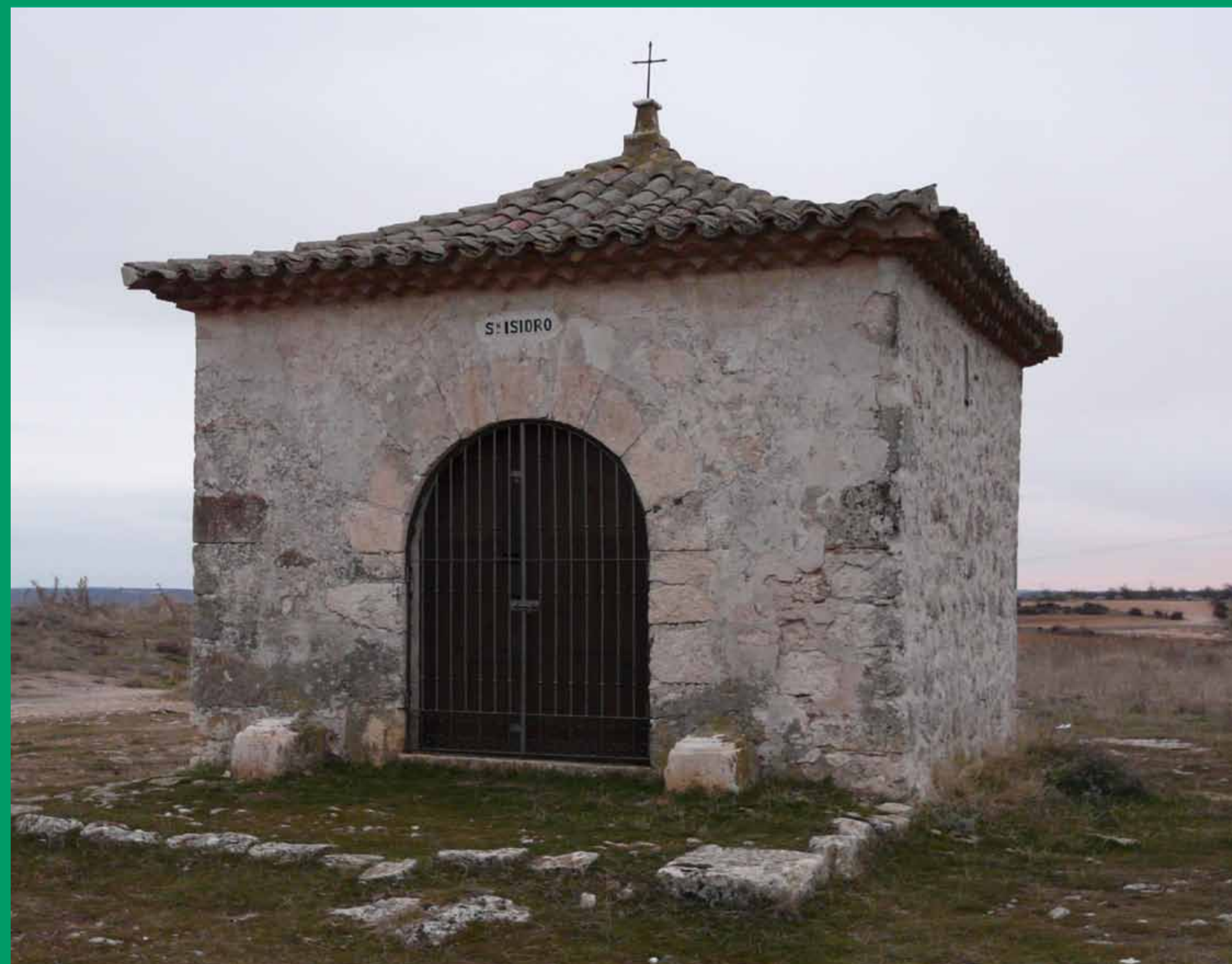
Ermita de San Isidro