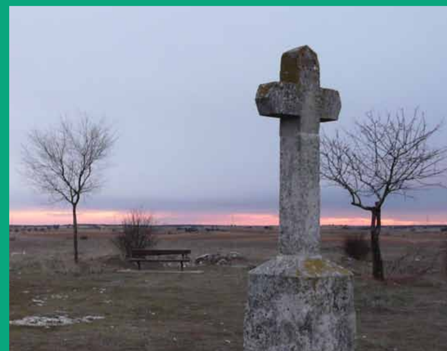
Cruz del antiguo Calvario

Esta pequeña capilla fue construida en 1581, a la vez que el Calvario anexo que data del mismo año. El templo ha ido cambiando de advocación con los tiempos. Así, en un primer momento se dedicó a Nuestra Señora de las Nieves, posteriormente a Santa Ana y actualmente a San Isidro, santo madrileño y patrono de los labradores. Frente a la ermita se levanta una cruz de piedra, que se erigió en recuerdo del antiguo vía crucis que había en el Calvario. Normalmente, todas las vísperas del 15 de mayo, día de San Isidro, se baja el santo en procesión hasta la iglesia del pueblo, donde se oficia una misa y se regresa de nuevo en procesión a la ermita.