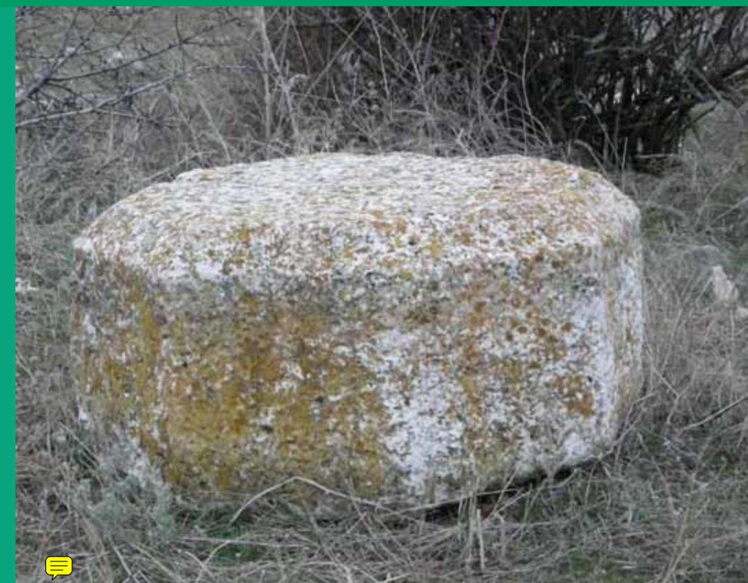
Balsa de la antigua Cruz del Calvario