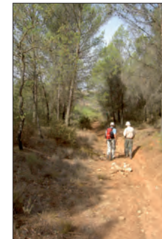
Senderistas camino de la ermita

papa Juan Pablo II a España. Alrededor de esta ermita hay varias mesas, un espeso pinar y un mirador con unas panorámicas extraordinarias sobre los valles del Tajuña y del Ungría, que bien justifican esta ruta.