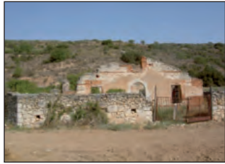
Restos de La Malena

dos kilómetros nos lleva a un nuevo cruce y unas ruinas: la Malena, un despoblado con antiguos muros. Hasta el cruce llega un camino desde el Lagar de la Máquina, al otro lado del valle y del río Ungría.