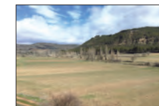
Valle de Ungría

A un kilómetro y medio, el carril llega a lo alto del monte y se topa de frente con otro buen carril; nosotros seguiremos por éste, a la derecha, para llegar en unos 750 metros hasta una ermita nueva, dedicada a la Virgen de la Dulce Alcarria y edificada hace unos años con ocasión de la primera visita del