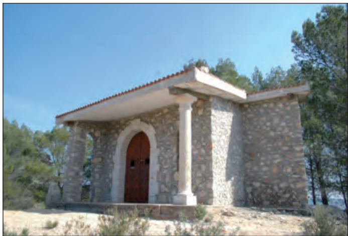
Ermita de la Virgen Dulce

Como tendremos tiempo, recomendamos al viajero recorra con detenimiento pero sin pausa las callejuelas de Horche y conozca sus monumentos.