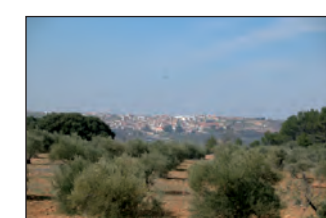
Paisaje cerca de la ermita

A unos 800 metros del cruce anterior nos encontramos con otro en el que abandonaremos la pista que traemos por el nuevo camino que nos sale a la izquierda, que rápidamente empieza a descender y que en algo más de