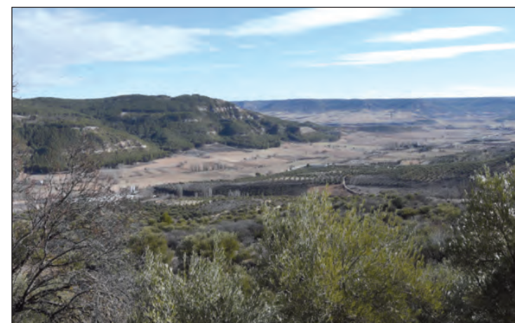
Sierra de El Picuzo

Desde la plaza seguimos, descendiendo por la calle Mayor hasta llegar a la Fuente Nueva, cercana al lavadero. De aquí parte, saliendo del pueblo hacia el SE, una calle, que poco después termina y se bifurca en dos caminos: el de la izquierda termina en una fábrica de tubos de hormigón, en la carretera, es por el que sube la ruta del Ungría. Nosotros seguimos por el viejo camino de Armuña, que discurre más arriba que el anterior. También por aquí se separa la ruta “¿Que es la Alcarria?”