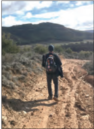
Senderista camino del Picuzo

Giraremos para seguir por el camino de la izquierda tomando dirección Sur para seguir bordeando al pinar y llegar, de nuevo, en kilómetro y medio al Molino Primero y girando a la izquierda donde cruzamos otra vez el río Ungría, para regresar al puente de la carretera, desandando el conocido camino de Armuña y ascender de nuevo a Horche por el mismo itinera-