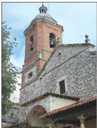
Vista de la iglesia

El nombre de Horche (u Orche) pudo ser el de alguno de esos enclaves, o se lo pusie-