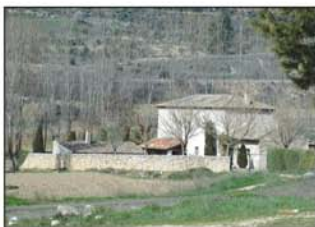
Molino sobre el Ungria

cruce (UTM=cruce02) para continuar de frente. A los 2 kms del inicio, el camino pasa bajo un tendido eléctrico, que lleva también la dirección de Armuña, de este lugar parte el camino (UTM=cruce03) que desciende a la vía de servicio de la N-320; la seguiremos hacia la derecha (UTM=via), tomando las debidas precauciones pues, aunque es una vía de servicio, tiene intensidad de tráfico. Poco después llegaremos a un puente (UTM=puente) sobre la carretera N-320 y la cruzaremos por este lugar. Continuaremos nuestro caminar por el otro lado de la carretera, siguiendo por un camino de tierra y que toma hacia el NO. A los 600 metros del puente giraremos a la derecha (UTM=cruce04) para cruzar el valle siguiendo por un camino que llega al cercano Molino Primero (UTM=molino), pasaremos por delante de él, siguiendo después por un camino que continúa al SE.