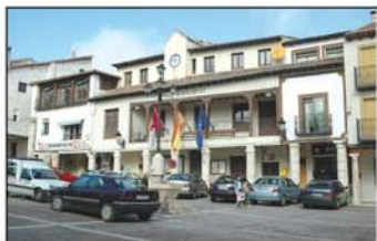
Plaza Mayor de Horche

El recorrido por Horche tiene lugares clave, que no debemos olvidar: la ermita de San Sebastián, con las hermosas vistas que sobre el pueblo y la cercana vega se divisan desde ella; la iglesia de la Asunción de estilo renacentista y recientemente restaurada, con artesonado mudéjar en su interior, una galería porticada en la entrada y amplio mirador rodeando la plaza de acceso; desde el otro extremo del pueblo, en el barrio del Albaicín, también se ofrecen bellas perspectivas del caserío de Horche, escalonado sobre los antiguos huertos, y no debemos olvidar el lavadero, con su curiosa forma de plaza de toros antes de realizar nuestra ruta y por el que