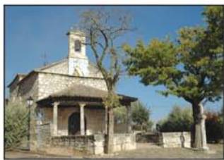
Ermita de la Soledad

pasaremos muy cercana a ella. Antes de entrar en la localidad, a la derecha, la ermita de la Soledad, un bello ejemplar de arquitectura popular donde se guarda la imagen de la patrona.