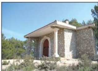
Ermita de la Virgen Dulce

la sombra del pinar, dejando a la derecha el fondo de un pronunciado barranco. Este ascenso nos muestra, contrastado con el fondo del valle del Ungría, el espeso pinar que puebla la Sierra de Horche, conocida aquí por el Picuzo.