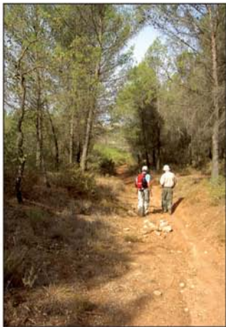
Caminamos por un frondoso pinar

A un kilómetro y medio, el carril llega a lo alto del monte y se topa de frente con otro buen carril (UTM=cruce06); nosotros seguiremos por éste, a la derecha, para llegar en unos 750 metros hasta una ermita nueva (UTM=ermita), dedicada a la Virgen de la Dulce Alcarria y edificada hace pocos años con ocasión de la primera visita del papa Juan Pablo II a España. Alrededor de esta ermita hay