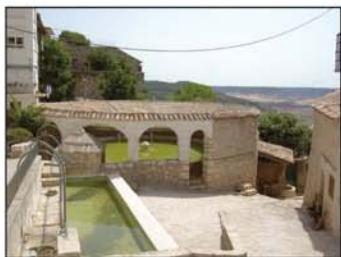
Fuente y lavadero de Horche